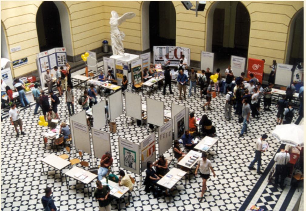
Lichthof im Hauptgebäude der TU Berlin