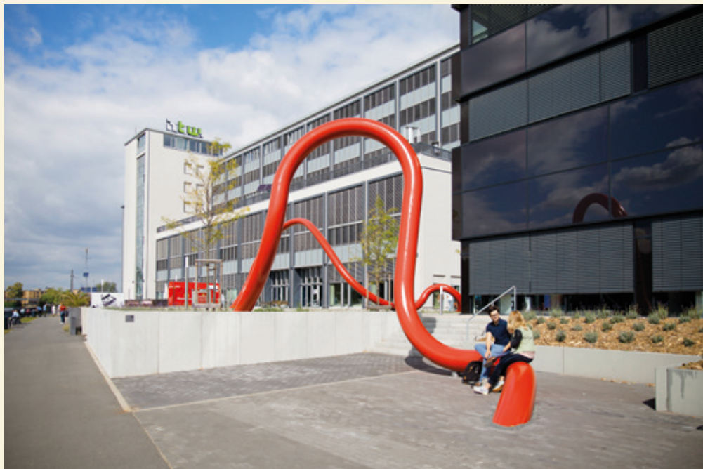
Kunst am Bau, im Hintergrund die Gebäude G und H